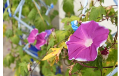
きれいな花が咲いた：1年生の朝顔

このように終業式が迎えられるのも、保護者・地域・関係者の皆様のご理解・ご支援のおかげと心から感謝しています。本当にありがとうございました。夏休みも子どもたちが安全に元気に過ごせますよう、引き続きご支援をお願いいたします。