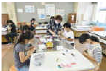
手芸クラブの様子

○球技・陸上 ○音楽 ○写真 ○マンガ・アニメーション ○ボード・カードゲーム ○パソコン