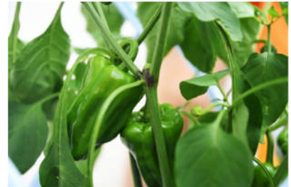
いきのいい実り：2年生のピーマン