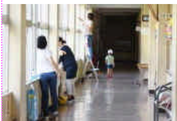
昨年度環境美化作業の様子