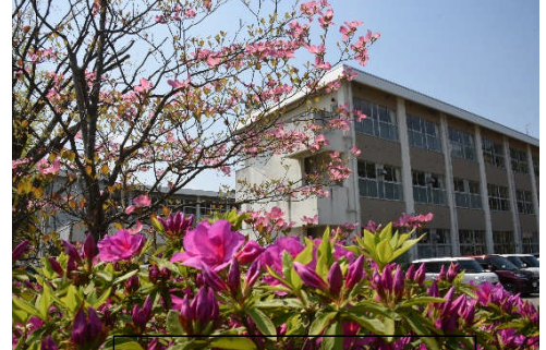
可愛いハナミズキとつつじ

本日、久しぶりに子どもたちを校門で出迎えました。元気な顔を見て「おはようございます。」のあいさつができたことを本当に嬉しく思いました。4月の登校日数はわずか8日間で、この1か月の大半を「おうちにいよう！」を守り、外に出ずにがまんしています。本当によくがんばっています。このように無事に過ごすことができているのも、ひとえに保護者、地域の皆様のご理解・ご支援のおかげと心から感謝申し上げます。