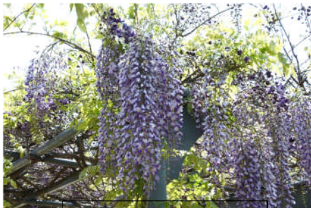
見事に咲いた校庭の藤

多くの国民が「がまんして乗り切ろう」「ここで気を緩めてはいけない」と行動を制限している様子が連日報道され、有名観光地や高速道路、新幹線、空港等は確実に人が減りました。又、経営が厳しい中、自粛要請に応え休業しているお店もたくさんあります。逆に、人が増えた場所や遊技場に長蛇の列の様子も報道され、がんばっている倉二っ子たちはどんな思いで見ているのかなあと大人の一人として複雑な気持ちになりました。個々それぞれの事情があるのであまり強い発言はできませんが、登校日に以下のことを子どもたちに伝えました。