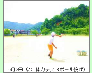
6月8日(火) 体力テスト(ボール投げ)

休憩や水分補給も適宜行い、残りの1学期も子どもたちの安全と健康を第一に考え取り組んでいきます。