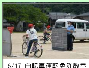
6/17 自転車運転免許教室

自転車はとても身近で、便利な乗り物です。しかし、時々、ヒヤとする場面を見かけることがあります。一つしかない命を守るために、「交通安全」について、ご家庭でも今一度話題にしていきたいと思えます。