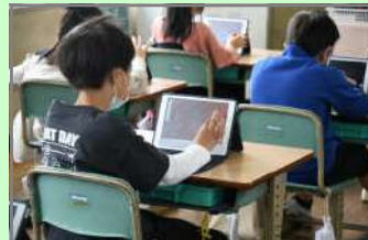
3年生:世界の行ってみたい場所を調べてみよう!