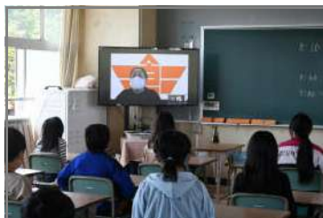
5/6(木)人権学習 安全指導

リモートでの実施となっても、まるで目の前で話を聞いているかのように、実施する行事や取組の目的をよく理解し、集中して参加できる倉二子たちです。ハウリングを起こしてしまうなど、機器のトラブルも教職員が対応し改善できるようになりました。