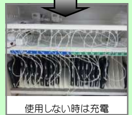
使用しない時は充電