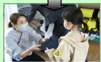
1年生:タブレット開き