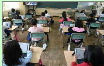
2年生:タブレットを使って絵や図を描いてみよう!

などについても発達の段階に応じて指導を行い、みんなが安心して便利にICTを効果的に活用できるよう、正しい情報モラルも身に付けさせていきます。