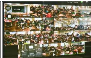
5/7(金)各学級の様子を見ながらいただきます!

今後、こうしたリモートによる学習が定着・充実してくると、遠く離れた学校の友達とも交流したり、現地に行けなくてもリモートによる社会見学を実施したりするなど、「遠隔教育」を実現し、子どもたちの学びをさらに深めることができるのではないかと、夢が大きく膨らんでいきます。