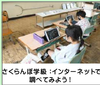
さくらんぼ学級:インターネットで調べてみよう!