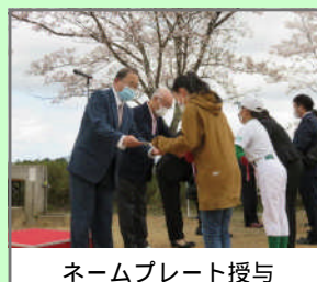
ネームプレート授与