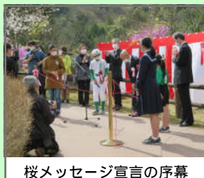
桜メッセージ宣言の序幕

「さくらまつり」のオープンを記念した「桜メッセージ宣言」の除幕に参加し、倉梯第二小学校のネームプレートを受け取り植樹した桜に取り付けました。