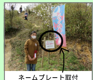
ネームプレート取付