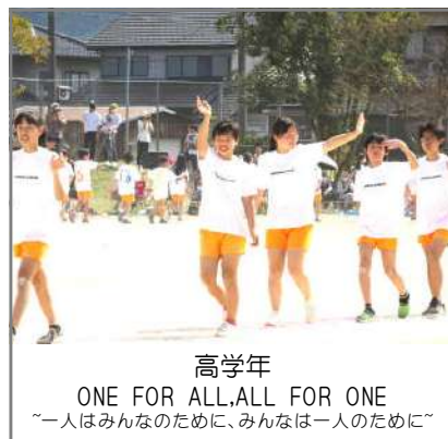
高学年 ONE FOR ALL, ALL FOR ONE "一人はみんなのために、みんなは一人のために"