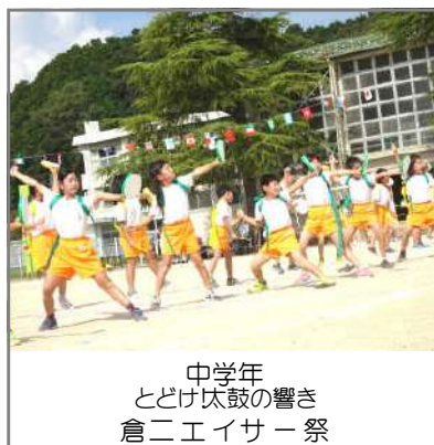
中学年 とどけ太鼓の響き 倉二エイサ - 祭