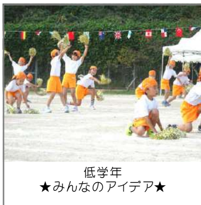
低学年 ★みんなのアイデア★

保護者の皆様には、お子様の健康管理や励まし、ご家庭でのご支援、またコロナ感染防止等にご協力いただき、感謝申しあげます。PTA本部や体育部、また有志の皆様には、暑い中、事前準備や朝早くからの準備、運営 後片付けなど大変お世話になりました。心より感謝申しあげます。皆様のご理解とご協力を得ることで運動会を無事終えることができました。今後とも本校の教育推進にご理解 ご協力をいただきますようお願いいたします。