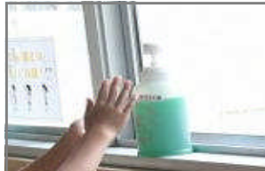
液体石けんを使った手洗い