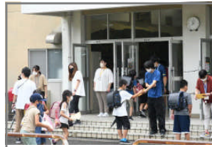
昇降口での健康チェック

舞鶴市でも感染者数は減少の傾向にありますが、引き続き、感染予防、拡大防止に取り組んでいきます。