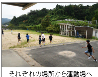
それぞれの場所から運動場へ

給食室からの出火を想定した二次避難でした。子どもたちは放送をよく聞き、出火元の給食室を避けるため、南校舎東階段は使わずに、「おはしも」を守って速やかに避難をしました。