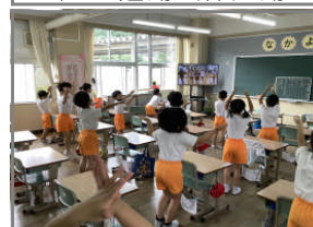
9/28 動画を見て応援練習