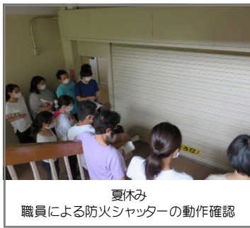
夏休み 職員による防火シャッターの動作確認

火事の際、建物内の延焼を防ぐため、学校には「防火シャッター」が設置されています。防火シャッターのすぐそばには「防火戸」が併設されており、防火シャッターが閉まっているときは、防火戸を通して避難します。