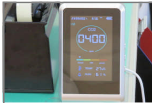
二酸化炭素濃度計測器