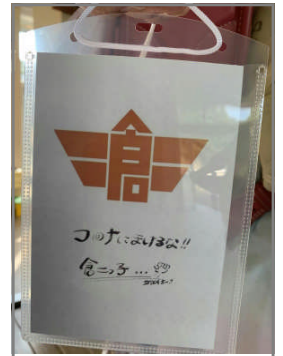
健康観察表ケース