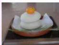
南舞鶴 スポーツ少年団様より